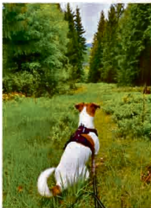
3. Platz eingereicht von Ulrike Voigt: „Ausflug mit Hund“