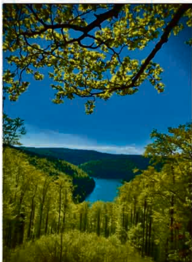
1. Platz eingereicht von Rebekka Lorz: „Blick vom Zillerstein“